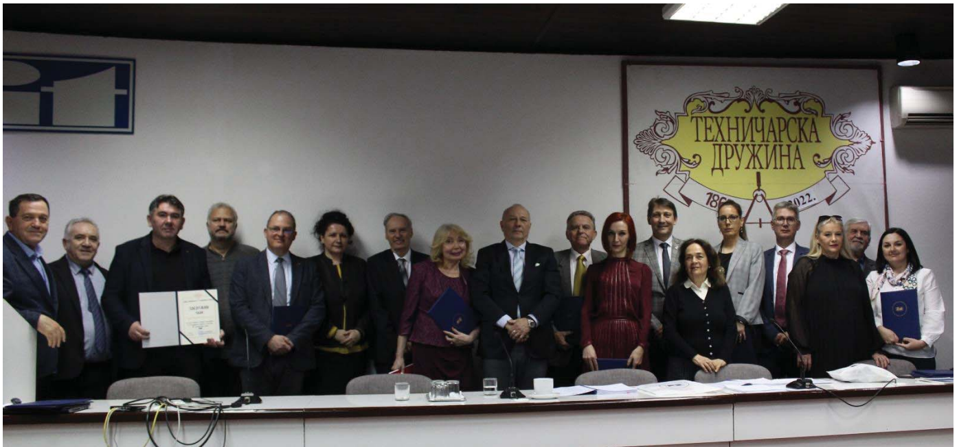
Godišnja skupština Saveza inženjera i tehničara Srbije 25.03.2022.