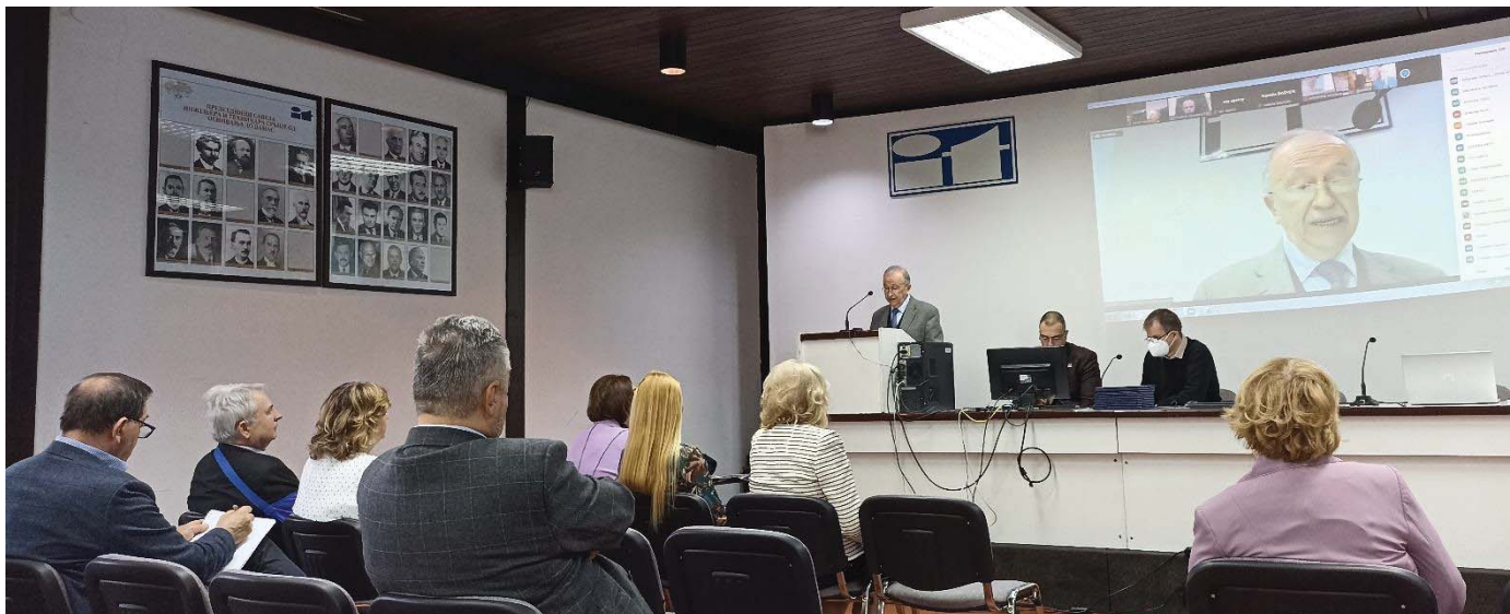
Svečano otvaranje Međunarodne naučne konferencije „Održivi razvoj i Zelena ekonomija“ (Beograd, 19-21.04.2022.)