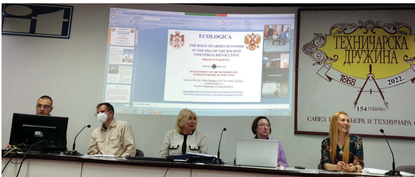
Početak rada Plenarnog zasedanja Međunarodne naučne konferencije (19.04.2022.)