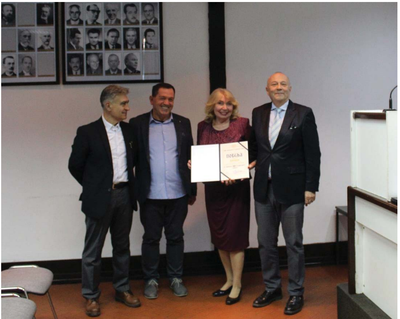
Dodeljivanje povelje Saveza inženjera i tehničara Srbije za najbolju publikaciju časopisu Ecologica